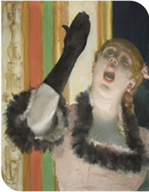
Chanteuse au gant, E.Degas

Mode d'expression vocal adapté à l'interprétation d'œuvres lyriques, l'Opéra est né en Italie, à Florence, vers la fin du XVI ème siècle.