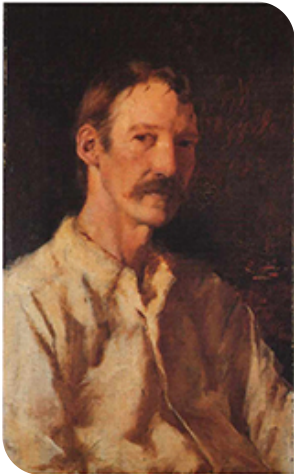
Robert Louis Stevenson, GP Nerli