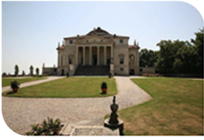
La Rotunda

Palladio ( 1508 – 1580 ) est l'architecte génial, auteur de l'église et du dôme de Venise, perspective incontournable de la place St Marc, ainsi que de nombreuses œuvres et somptueuses demeures en Vénétie.