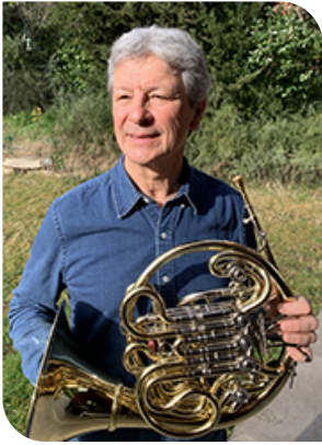
Le cor, photo J Nicod