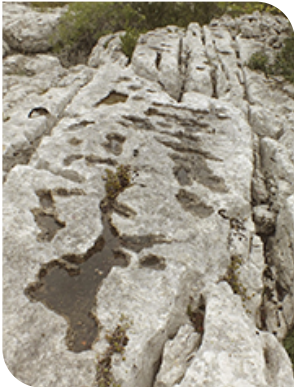
"Les gras"

Du Col de l'Escrinet à Banne, les « Gras » forment un ensemble de plateaux calcaires séparés par des gorges profondes. L'eau infiltrée y a formé des paysages typiques du « karst ». La position de ces plateaux au pied des Cévennes les soumet à des épisodes violents de précipitations et de crues, alternant avec les étiages d'été.